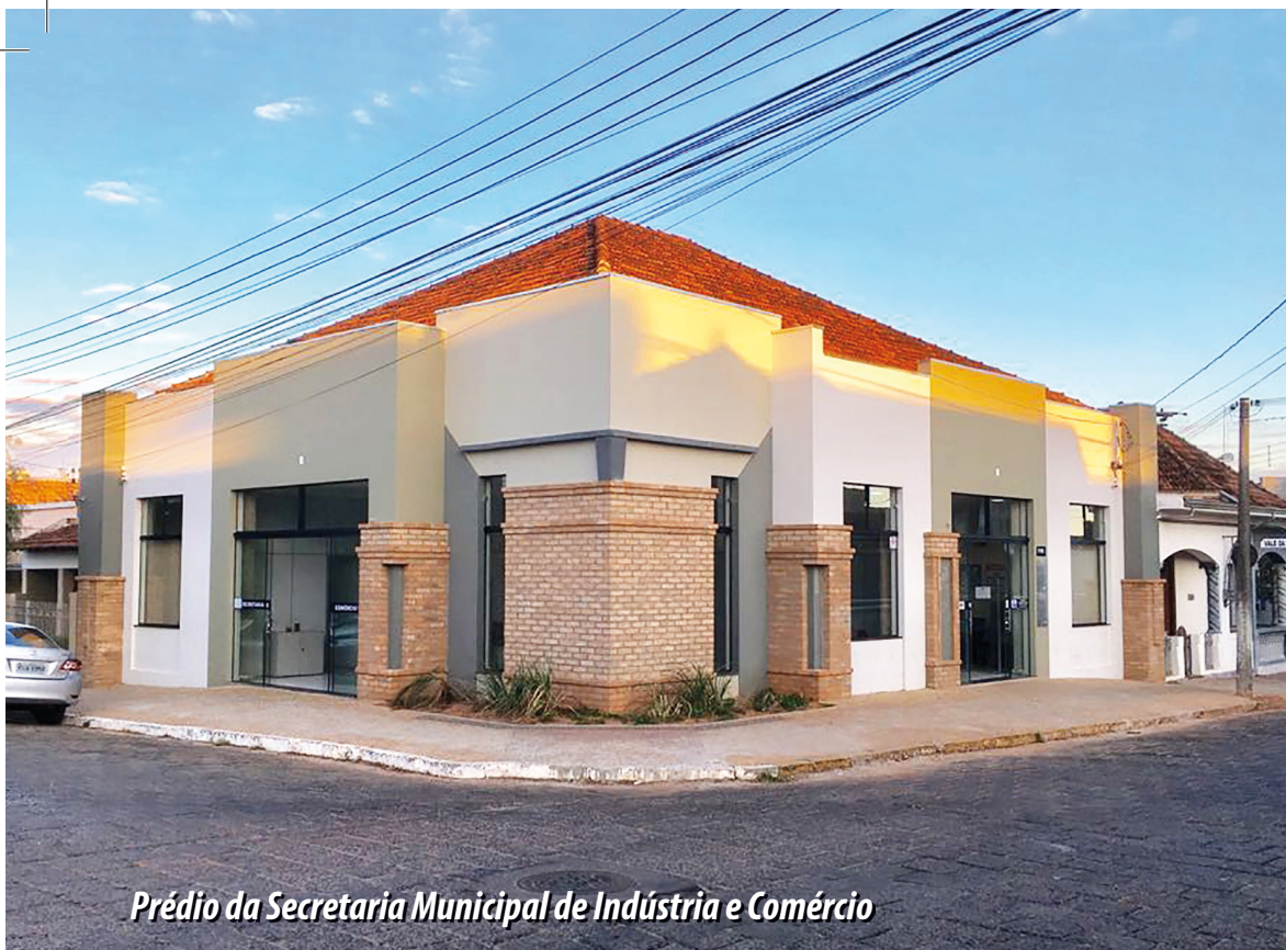
Prédio da Secretaria Municipal de Indústria e Comércio