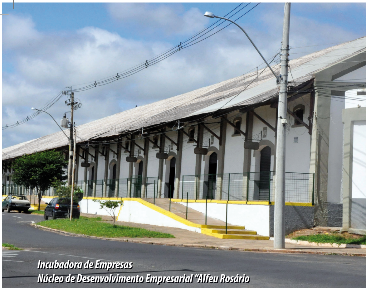
Incubadora de Empresas Núcleo de Desenvolvimento Empresarial "Alfeu Rosário"